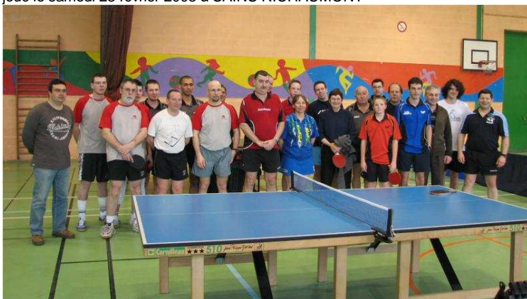
CRITERIUM FEMININ, joué le 23 février 2008 à FRESNOY LE GRAND