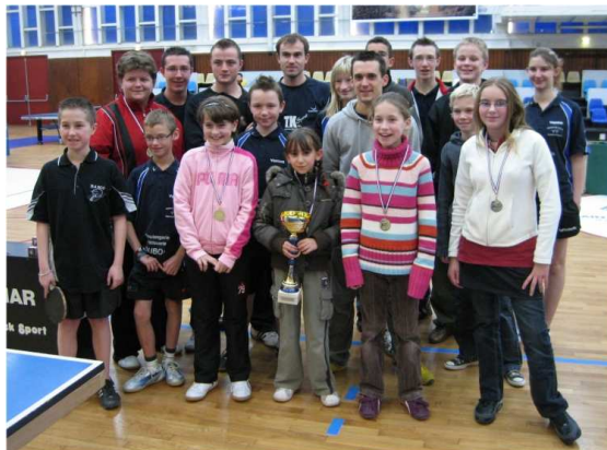
L'équipe VICTORIEUSE : TT St QUENTIN.